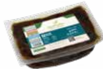
PACKING 1000 G

Carton Packing : 410x290x100 - 8 Wooden pallet : Pcs in carton 160 ktn Plastic pallet size :1200 x 1000 x150