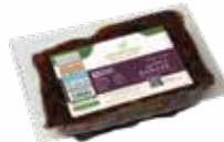
PACKING 1000 G

Carton Packing : 410x290x100 - 8 Wooden pallet : Pcs in carton 160 ktn Plastic pallet size :1200 x 1000 x150